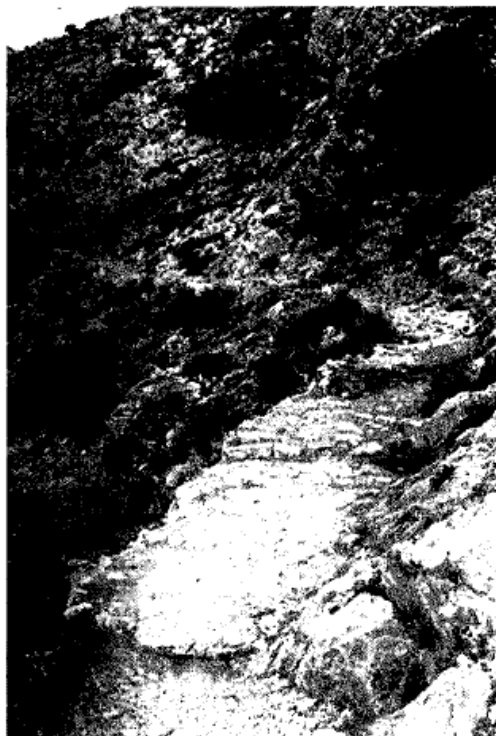
Rehabilitació del camí empedrat de Santa Caterina

L'abandó dels forns del Montgrí va produir-se per raons econòmiques. La funció dels forns de calç del Montgrí era proporcionar l'abastiment de calç