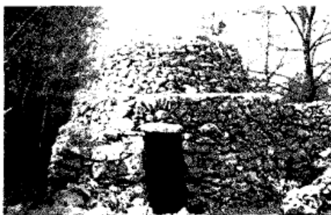
Barraca monumental: la barraca d'esti Xeu.

la vinya no tornaven cada nit al poble i que, a l'entorn de la finca, construïren una barraca per guardar les eines, el menjar i refugiar-s'hi en cas de mal temps. També els nous terrenys necessitaven ser netejats i delimitats i, per això, hi situaren murs - aixarts - utilitzant les mateixes pedres que n'extreïen, i que són els que trobem àmpliament escampats per la muntanya.