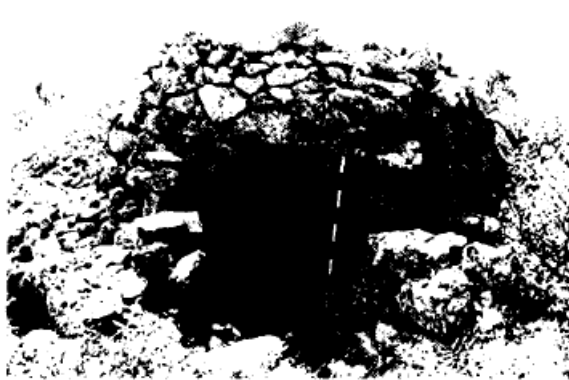
Barraca Mitjana al sector anomenat Mala Terra