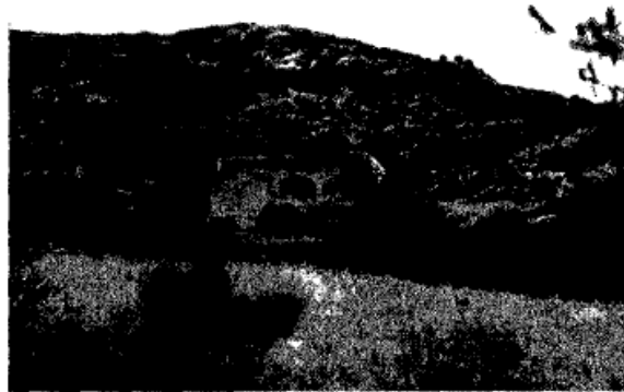
El mas Reginell, en realitat un portal per al bestiar

Els orígens del treball cal situar-los l'any 1998 moment en el qual un grup d'amics llicenciats en història, moguts per la voluntat de fer una anàlisi del