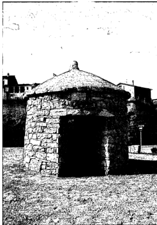
Barraca construïda a la rotonda que dóna entrada al poble de Calders (2005).

L'inici d'aquest procés cal buscar-lo a principis dels noranta, quan a la nostra comarca es produeixen dos factors que conflueixen en un mateix objectiu. Primer de tot assistim a un degoteig d'estudis publicats que 1 intenten posar en valor el patrimoni en pedra seca, i redescobreixen aquests elements a un públic encara minoritari. El segon factor és el naixement de la D.O. “Pla de Bages” l'any 1995