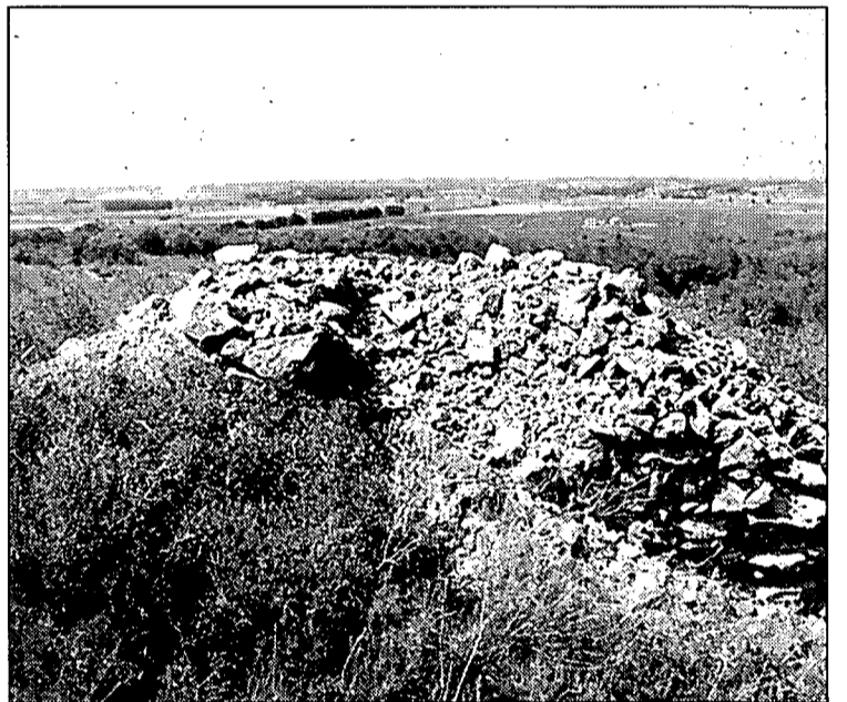
Dues de les cabanes documentades pel museu, al massís del Montgrí. A dalt, una de reconstruïda. A baix, una d'enderrocada.

A la base, un gran mur amb gruixos que poden superar els quatre metres permet suportar tot el pes d'un segon pis menys gruixut, que alhora té al seu damunt un tercer nivell, més lleuger. D'aquesta manera el pes es distribueix cap a baix i s'aguanta gràcies al gruix del mur. A l'interior, la cabana forma una falsa volta, molt més ampla, que es va estrenyent fins pràcticament ajuntar-se a la part més alta. En aquest punt hi ha una pedra mòbil que permet tancar totalment la cabana en cas de pluja i obrir-la com a escapament de fum de la llar. L'única entrada a la cabana és a la cara sud.