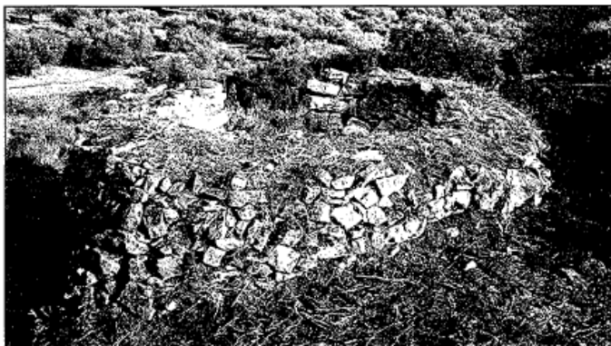
Forn de calç a la carretera vella del Mas de Barberans

Pel que fa al treball amb els forns, inicialment s'han fet treballs de neteja de la vegetació adjacent i dels seus accessos. Després s'han retirat les nombroses deixalles abocades des de fa temps al seu interior. Posteriorment s'han realitzat treballs de reforç a les parets per evitar la degradació dels forns. Per últim s'ha dissenyat i instal·lat la senyalització del forn del Coll d'en Solà i del Partidor.