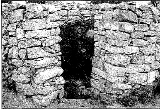
Forn de calç del Coll d'en Solà

El forn de calç del Coll d'en Solà estava completament cobert de runes i deixalles. Per la proximitat al poble es va decidir de retirar-li la runa, netejar-lo, pujar-li unes parets de pedra i senyalitzar-lo. Aquest forn es troba en