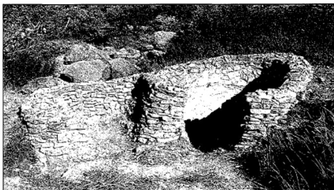
Forn de calç a l'altura del camp de tir de les Comes