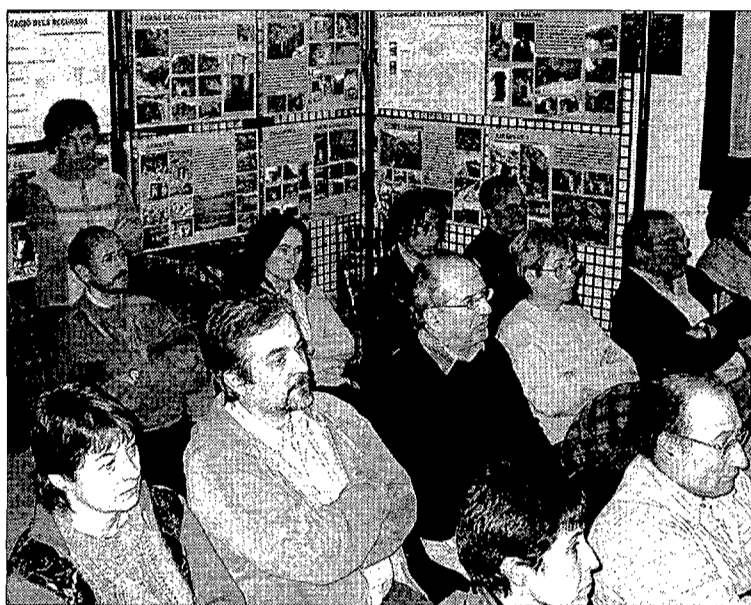
Ha tingut força èxit

L'exposició compta amb una vintena de plafons que inclouen diferents fotografies