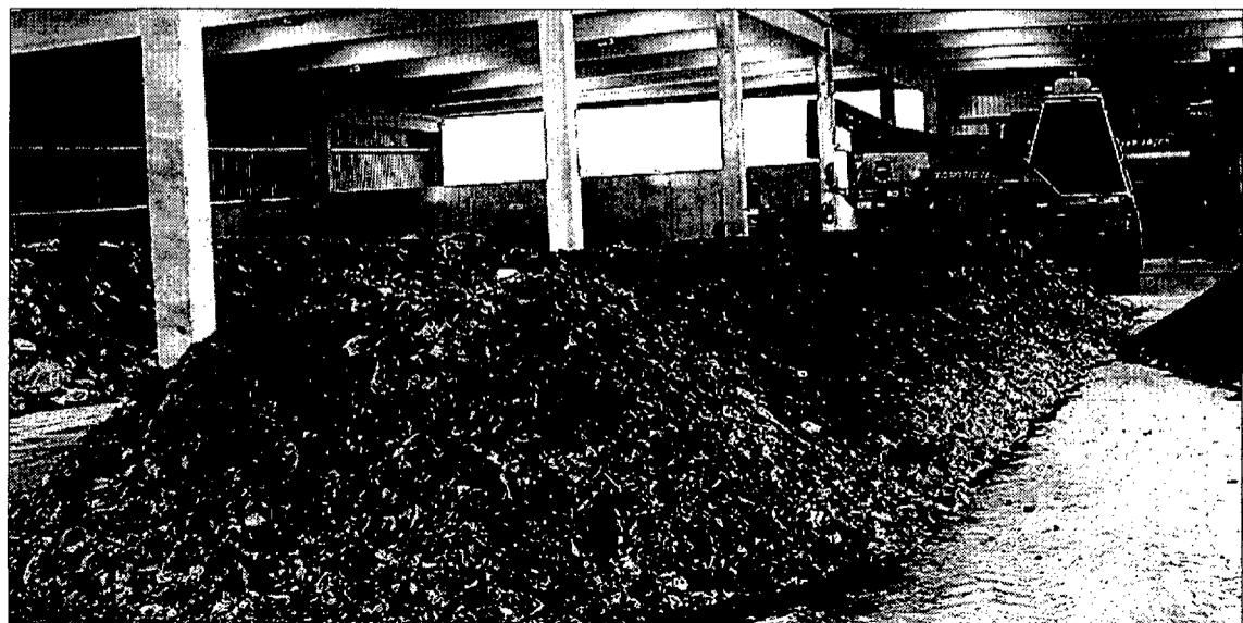
El centre de l'Espluga és un dels llocs escollits per la Generalitat

El Centre de Tractament de Residus de la Conca de Barberà, ubicat al terme municipal de l'Espluga de Francolí, va ser inaugurat el setembre de l'any passat pel conseller de Medi Ambient de la Generalitat, Salvador Milà.