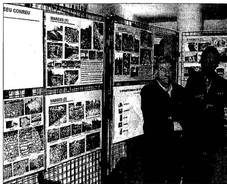
La mostra és itinerant