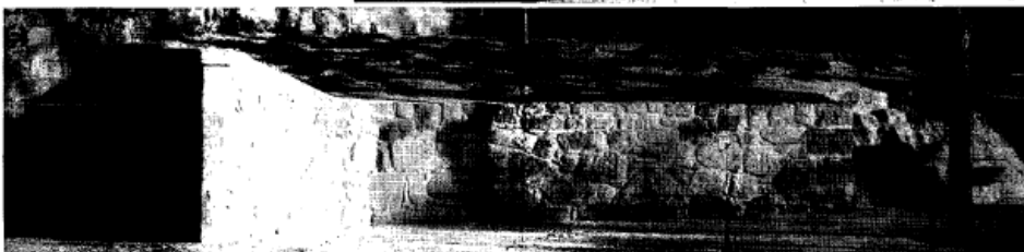
1 - 2 . Vista externa de l'entrada al passadís lateral d'accés a l'interior, i aspecte extern del Pou de Gel de Ponts.