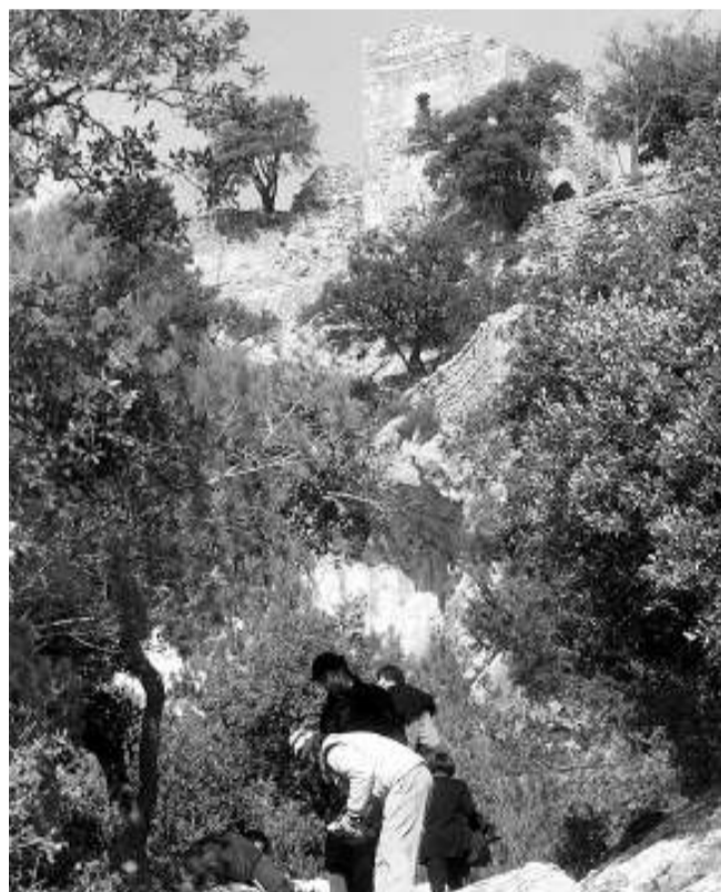
La Trapa, un edifici vinculat als templers, i el castell d'Alaró són dos dels punts més atractius de la Ruta de la Pedra en Sec.

– WEB: www.conselldemallorca.net/mediambient/pedra