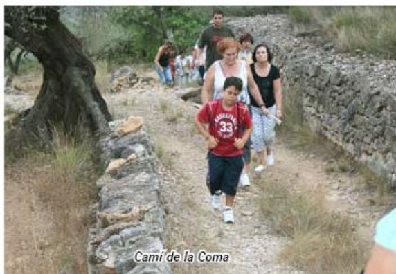
Cami de la Coma