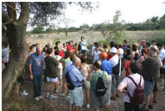
Explicacions al Povet de Martí