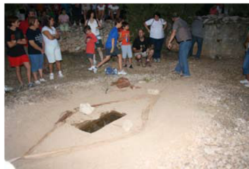
Preparant el filat

Dins de la proposta d'itineraris del grup Terres de Cruïlla, www.terresdecruïlla.org , format pels centres d'Estudis de Rossell, Alcanar, Santa Bàrbara, Mas de Barberans, Ulldecona i la Sénia, es va fer a la Sénia el dia 26 d'agost la proposta d'itinerari del Centre d'Estudis Seniençs titulada Anar al vilar. Oliveres, pedra en sec i formes de vida al Secà . Des de les Escoles Velles i seguint el passeig de la Clotada, la costa de la Pedrola, i el camí de la Coma vam arribar al pou de les Senioles. Després, a una finca propera de la partida de les Comes van poder observar oliveres centenàries i algunes de mil·lenàries, construccions de pedra en sec com barraques i marges, i barraques per a la cacera del tord. La visita fou tot un èxit amb molta participació aconseguint reunir un grup de més de cent persones. La costa de la Pedrola és actualment un camí d'accés a finques