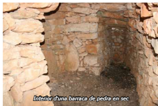
Interior d'una barraca de pedra en sec